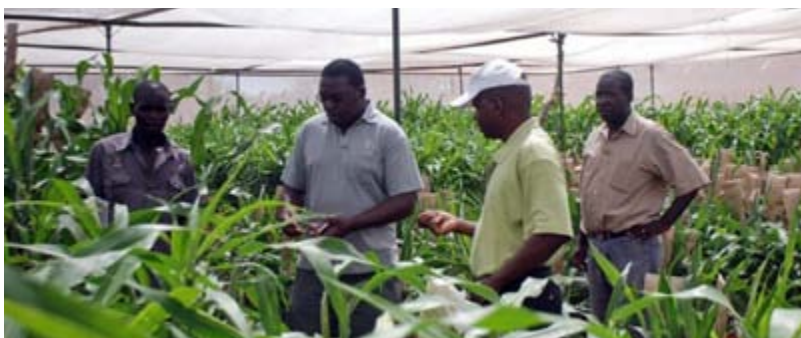
Essai de recherche au Nigeria

En Afrique, les AgDPO apportent une aide aux plans nationaux d'investissement à travers lesquels les pays mettent en œuvre le Programme détaillé de développement de l'agriculture africaine (PDDAA, adopté à Maputo en 2003). En juillet 2014, trois pays avaient bénéficié de l'assistance de la Banque mondiale par le biais des AgDPO : le Ghana, le Mozambique et le Nigeria.