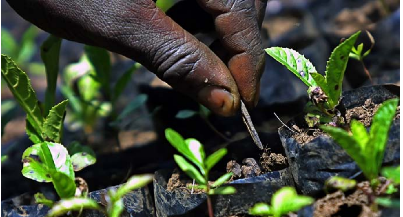
Entretien de plants au Kenya : les futurs prisonniers des lois sur la protection des variétés végétales ?

Sous la rubrique des « lois semencières », il existe divers types d'initiatives portant sur des lois et des politiques qui ont une influence directe sur les catégories de semences qui peuvent être utilisées par les petits agriculteurs. Nous nous intéresserons à deux types d'initiatives : les lois sur la propriété intellectuelle qui accordent aux obtenteurs des monopoles avalisés par l'État (au détriment des droits des agriculteurs), et les lois sur la commercialisation des semences qui réglementent le commerce en ce domaine (en rendant souvent illégal l'échange ou la vente de semences des agriculteurs). 22