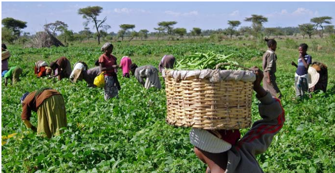
Cueillette de haricots verts en Éthiopie, dans la Coopérative maraîchère de Dodicha, soutenue par l'USAID. Les haricots seront vendus à un exportateur local qui les revendra à des supermarchés en Europe.