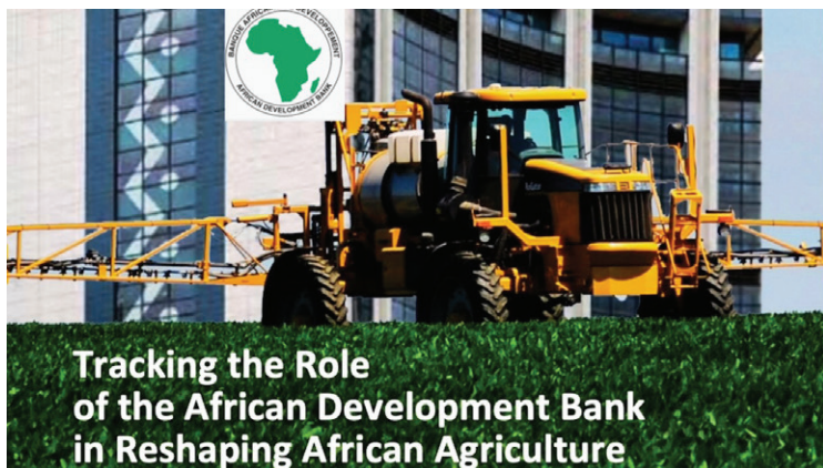
Tracking the Role of the African Development Bank in Reshaping African Agriculture