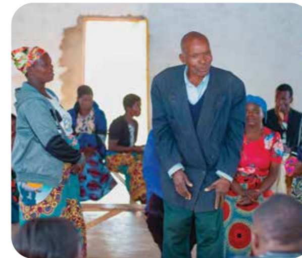
Le SFHC utilise des techniques de formation innovantes pour diffuser les connaissances.

d'apprentissage locale. Éliminez les obstacles à l'adoption en fournissant des équipements de base là où il constitue le facteur limitant et en renforçant les services de vulgarisation pour consolider les pratiques paysannes. Associez-vous aux universités pour documenter les preuves de terrain à des fins de plaidoyer, et appuyez cela par des réformes foncières et des politiques agricoles qui font de la restauration des sols une priorité nationale.