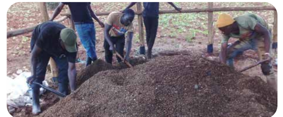
Production de bioproduits et valeur ajoutée.