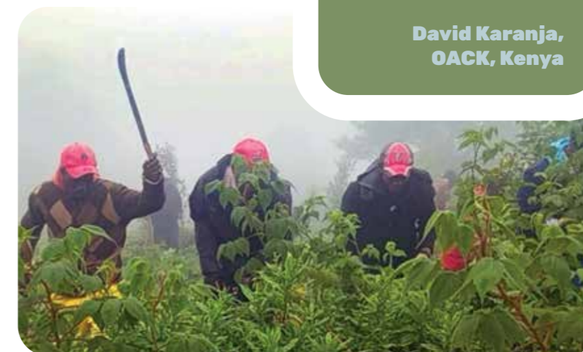
Expérimentation de différentes pratiques, y compris la culture verticale.

La restauration de nos sols ne peut être assurée par les agriculteurs seuls. Les pouvoirs publics doivent renforcer les services de vulgarisation agricole et mettre en place des politiques qui favorisent les engrais organiques parallèlement aux engrais chimiques. Les consommateurs ont eux aussi un pouvoir d'action : lorsqu'ils exigent des aliments cultivés sur des sols sains, les agriculteurs et les décideurs politiques commencent à changer. La santé des sols exige une responsabilité collective de la part des agriculteurs, des pouvoirs publics, de la société civile et des bailleurs de fonds.